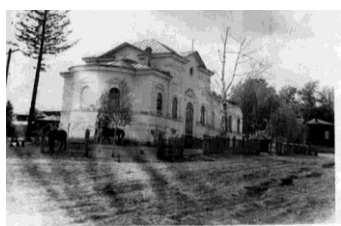
С. Молчаново. Церковь. 1956г.