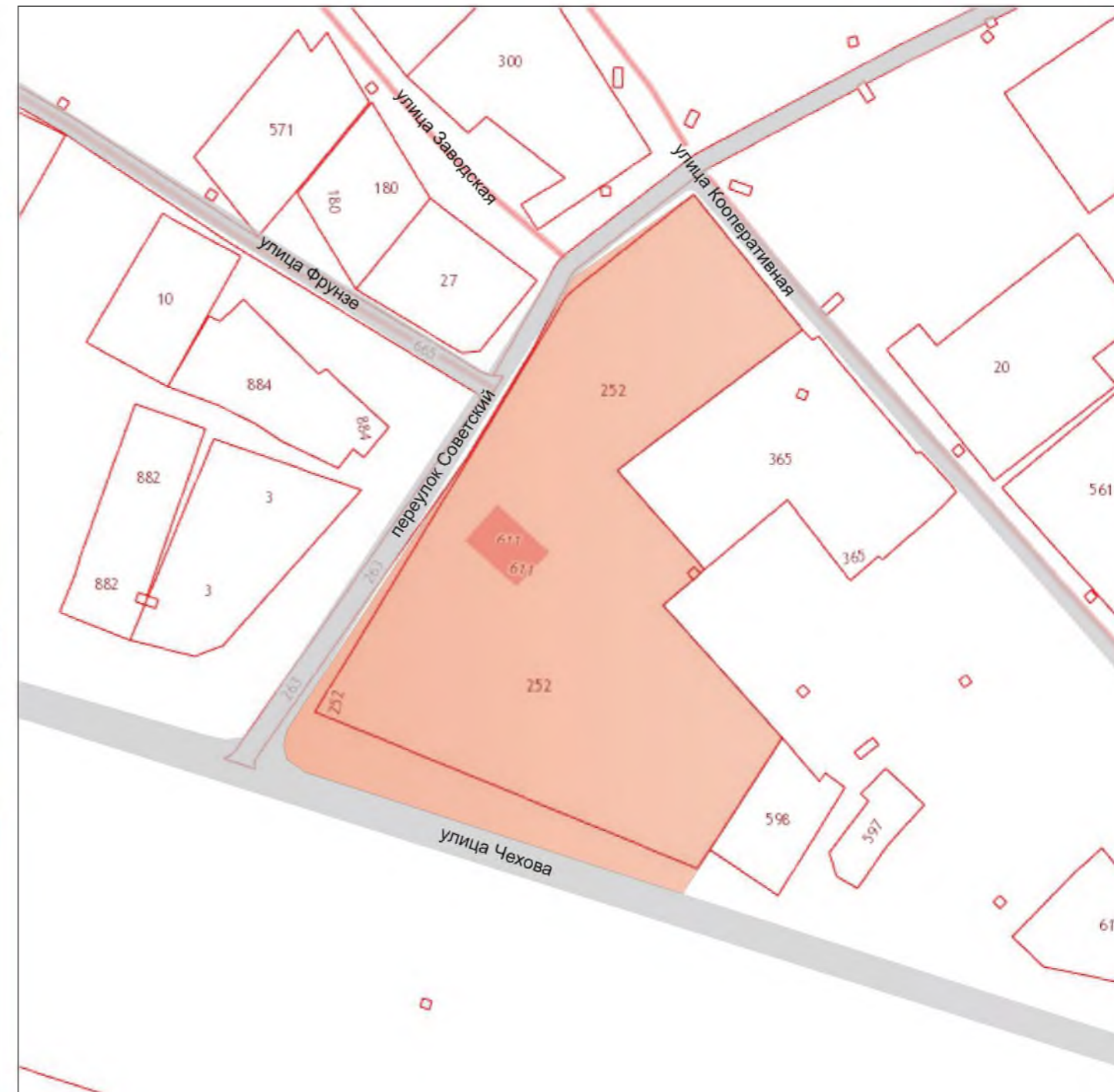
Парк культуры и отдыха по адресу: ул.Заводская,3