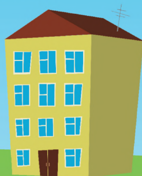
Управление управляющей организацией

Важно выбрать профессионального управляющего