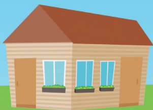
Непосредственное управление собственниками

Свои обязанности по управлению, содержанию и ремонту дома собственники могут осуществлять сами либо передать их специализированным организациям