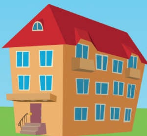
Управление ТСЖ, ЖК